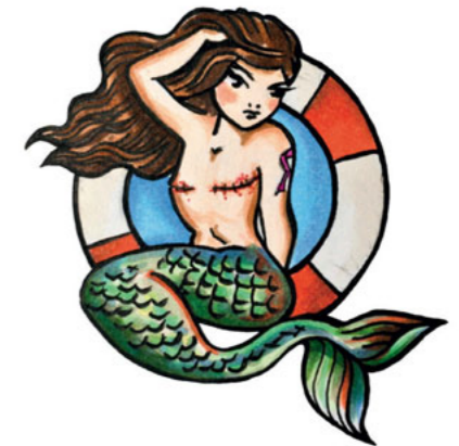
Illustration: Andrea Becker

Wir meinen, dass die Weiblichkeit einer Frau nicht davon abhängt, ob sie eine Brust hat oder nicht.